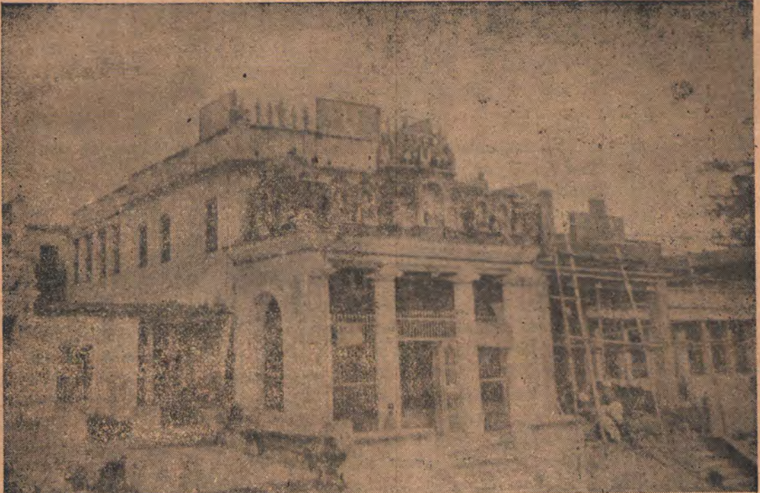
ஸ்ரீ காஞ்சி ஸன்னிதி வீதியில் நம்பிள்ளை ஸன்னிதி

1939ஆம் ஆண்டில் ஸ்ரீ காஞ்சியில் நம்பிள்ளை ஸன்னிதியமைக்க நேர் பட்டதும் அடியேனுடைய வாழ்க்கையில் தனிப்பட்டதொரு பாக்யவிசேஷம். நம்பிள்ளை ஸன்னிதி நிர்மாணத்தைப்பற்றின ஆலோசனை அடியேனுடைய